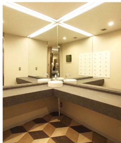
パウダーコーナー