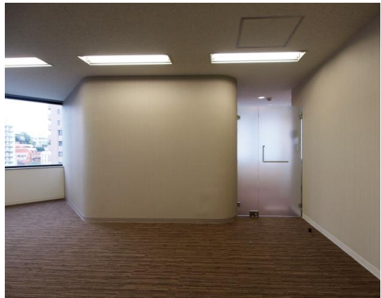
アースカラーの優しい色合いのインテリア