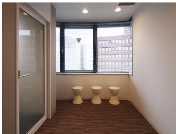
来客待合スペースとして前室を設置